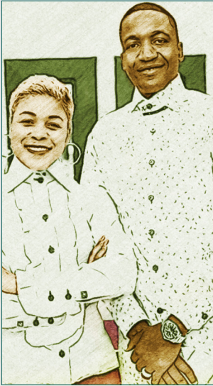
ការស្តាប់ - តើអ្នកព្រះគុណអ្វី?

១ របាយការណ៍ ១៦:៣៤ (ពគប) ចូរអរព្រះគុណដល់ព្រះយេស៊ូវ ដ្បិតទ្រង់ល្អ ពីព្រោះ សេចក្តីសប្បុរសនៃទ្រង់ នៅសែសកល្យជានិច្ច។