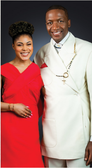
వరద లేదా హింస మిమ్మల్ని కదిలించదు.